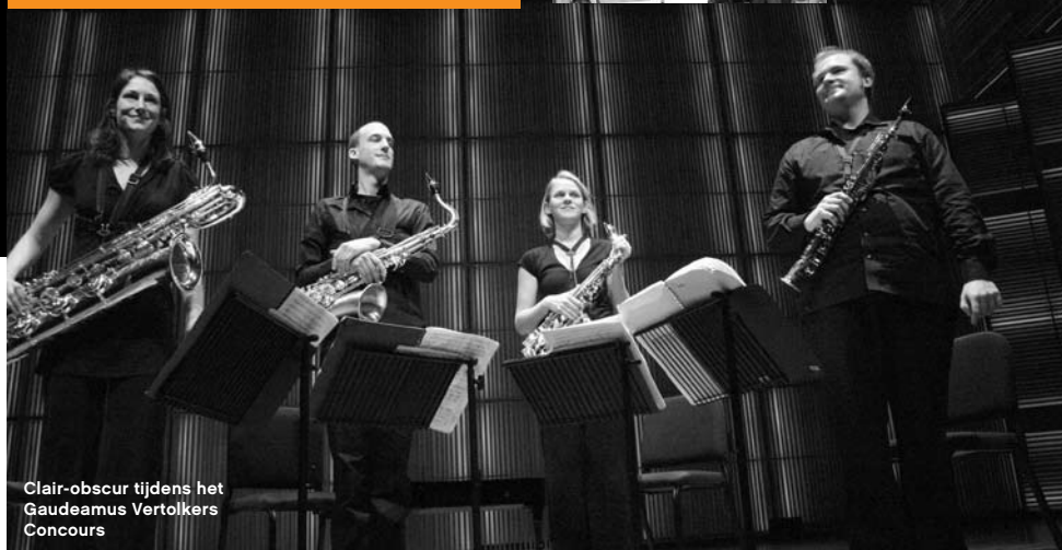
Clair-obscur tijdens het Gaudeamus Vertolkers Concours