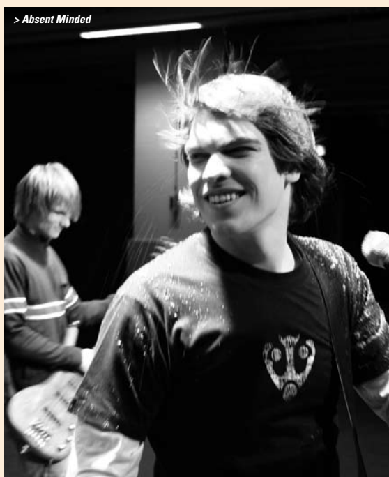
> Absent Minded

de betreffende act ter beschikking gesteld ter promotie van hen zelf. Voor het initiatief zijn inmiddels de eerste namen bevestigd: Ninthe en Absent Minded. Eens in de twee maanden wordt van een artiest een clip geproduceerd en het programma wordt in ieder geval voor de periode van één jaar gemaakt.