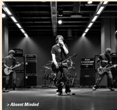
> Absent Minded