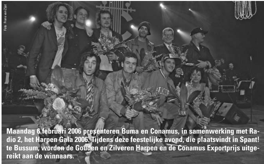
Maandag 6 februari 2006 presenteren Buma en Conamus, in samenwerking met Radio 2, het Harpen Gala 2006. Tijdens deze feestelijke avond, die plaatsvindt in Spant! te Bussum, worden de Gouden en Zilveren Harpen en de Conamus Exportprijs uitgereikt aan de winnaars.

De Gouden en Zilveren Harpen behoren tot de belangrijkste prijzen van de Nederlandse muziek. Zowel de Gouden als de Zilveren Harpen worden door een jury van deskundigen toegekend.