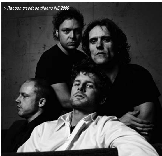
> Raccoon treedt op tijdens NS 2006

Tijdens Noorderslag Weekend is er een speciale 'Focus op Duitsland': zo wordt in samenwerking met de EVD een aantal panels georganiseerd over de bijzonderheden en de kansen die de Duitse markt biedt voor de muziekindustrie. Ook spelen tenminste eenentwintig Duitse bands in het avondprogramma en worden twee