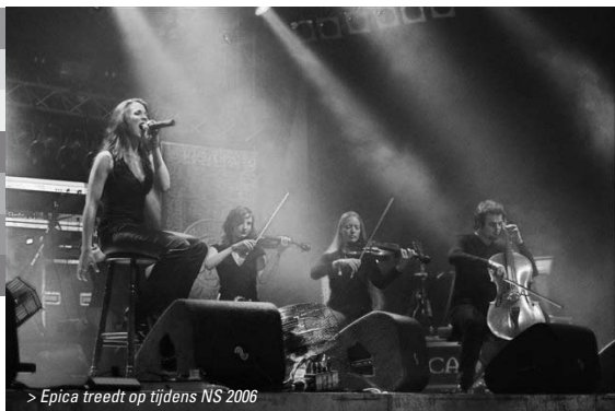
> Epica treedt op tijdens NS 2006

Zaken als gemeentelijk popbeleid, piraterij, geld verdienen met downloads, de onaantastbare opkomst van het urban-genre of 'popmuziek = wel/niet cultuur' komen allemaal aan bod tijdens het aankomende Noorderslag Seminar, op 12, 13 en 14 januari in Groningen. Het seminar vindt plaats op de dagen van de EuroSonic en Noorderslag festivals in De Oosterpoort in Groningen.