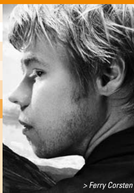
> Ferry Corsten