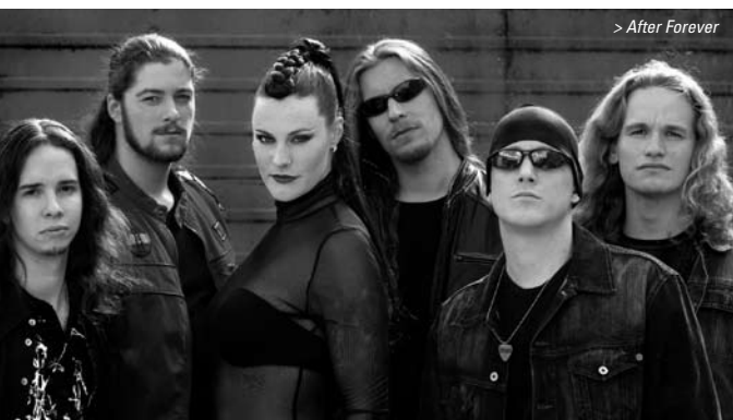
> After Forever