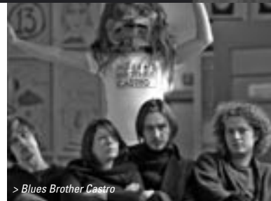
> Blues Brother Castro

Een nieuw onderdeel op Muzikantendag 2005 is 'The Case'. Tijdens 'The Case' worden alle aspecten van een muziekcarrière behandeld: bands en singer/songwriters kunnen zich van tevoren via OngekendTalent aanmelden. Uit alle aanmeldingen worden één band en één singer/songwriter geselecteerd en van beiden wordt één nummer bewerkt en opgenomen. Ook krijgen ze allebei een ervaren manager toegewezen en worden ze de hele dag